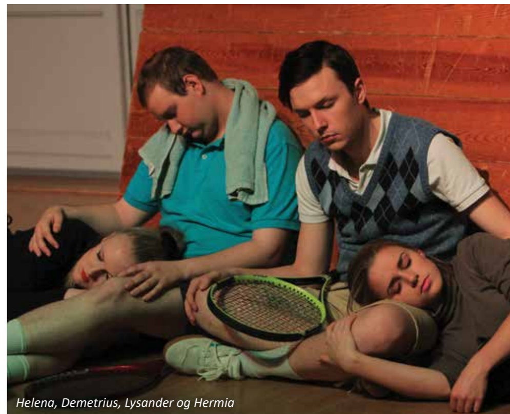
Helena, Demetrius, Lysander og Hermia