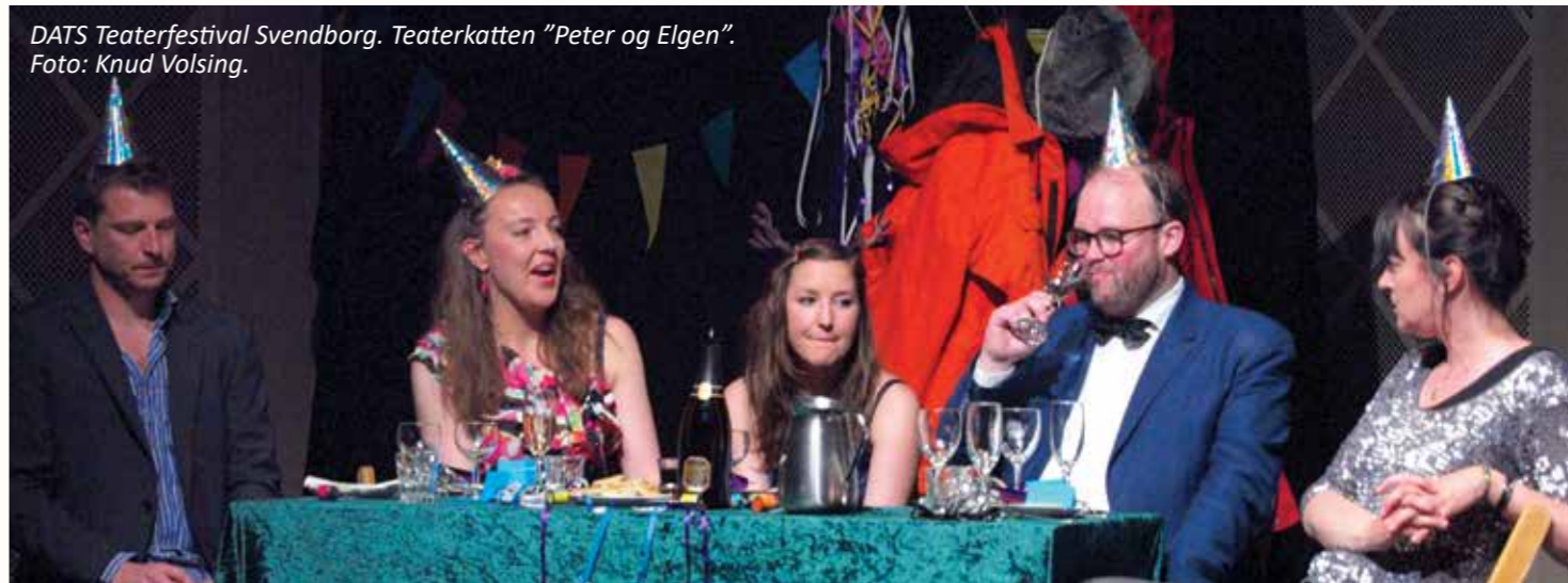
DATS Teaterfestival Svendborg. Teaterkatten "Peter og Elgen".

Opstarten af Plets kud på Fyn betyder, at DATS nu har samarbejder omkring Plets kud på både Sjælland, Fyn og i Jylland.