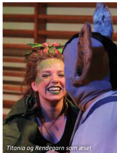
Titania og Rendegarn som æsel