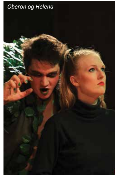
Oberon og Helena