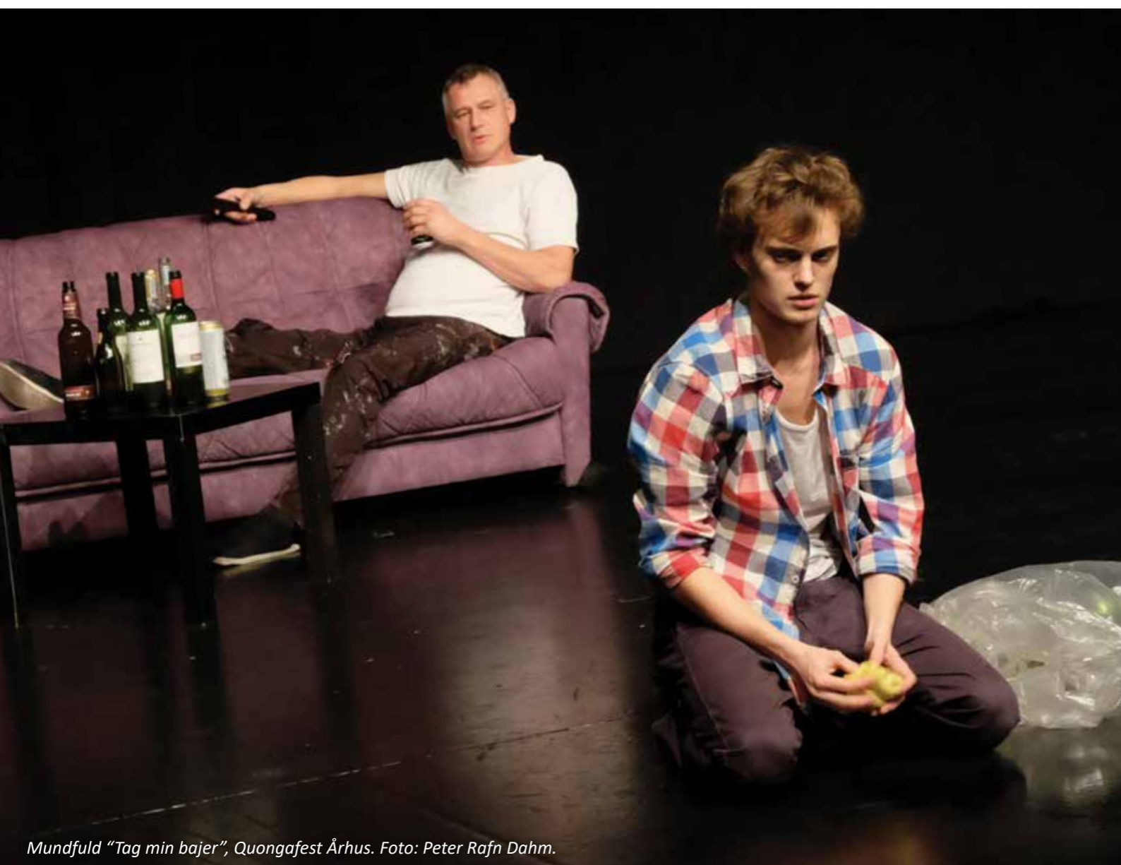
Mundfuld "Tag min bajer", QuongaFest Aarhus.

og lave, lige hvad man vil og til hver en tid gøre det om, eller lave noget nyt, uden de store konsekvenser. Intet er på spil, og samtidig er alt på spil, eller rettere sagt i spil. Det er det, der gør vækstlaget alsidigt og dynamisk og, som jeg mener, er en af dets stærkeste forcer. Derfor ser jeg ikke et nyt vækstlagsteater men i stedet en måde at være vækstlagsteater på.