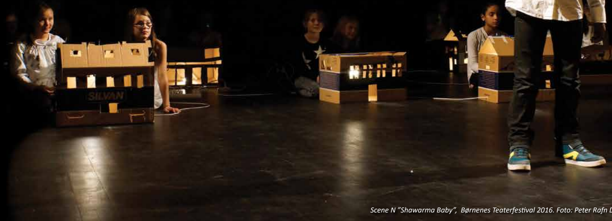
Scene N "Shawarma Baby", Børnenes Teaterfestival 2016.