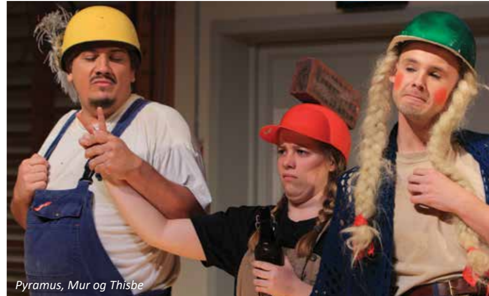
Pyramus, Mur og Thisbe