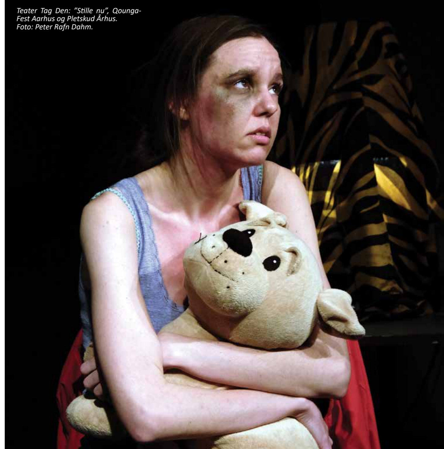
Teater Tag Den: "Stille nu", Qounga-Fest Aarhus og Plets kud Århus.

arbejde i gang med at få anerkendt og udbredt de mange spændende kurser, der skal hjælpe med at højne kvalitet og innovation i teatermiljø og fødekæde i hele landet: