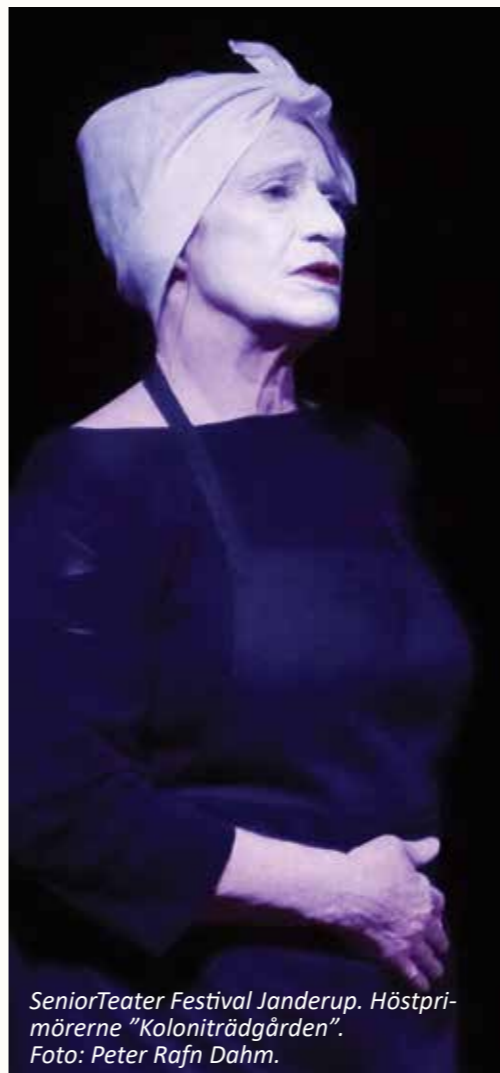
SeniorTeater Festival Janderup. Höstprimörerna "Kolonitraggården".