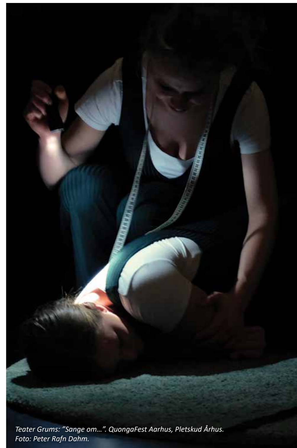
Teater Grums: "Sange om...". QuongaFest Aarhus, Pletsrud Århus.

Jeg vil dog erklære mig enig med Peter, der i sit indledende oplæg peger på en tendens inden for vækstlaget, der stiler mod et mere eksperimenterende og uafhængigt scenemiljø. Om den er ny, tror jeg ikke, men den er i hvert fald voksende. Efter min opfattelse er der tale om en ikke-nærmest anti-institutionel retning, der gør det til sin kunst at hoppe ind og ud af konventioner ved at have en bevidsthed omkring dem, og derfra tage aktive valg om, hvilke man vil arbejde med, og hvilke man vil sprænge i stykker. Drivkraft og motivation kan være for-