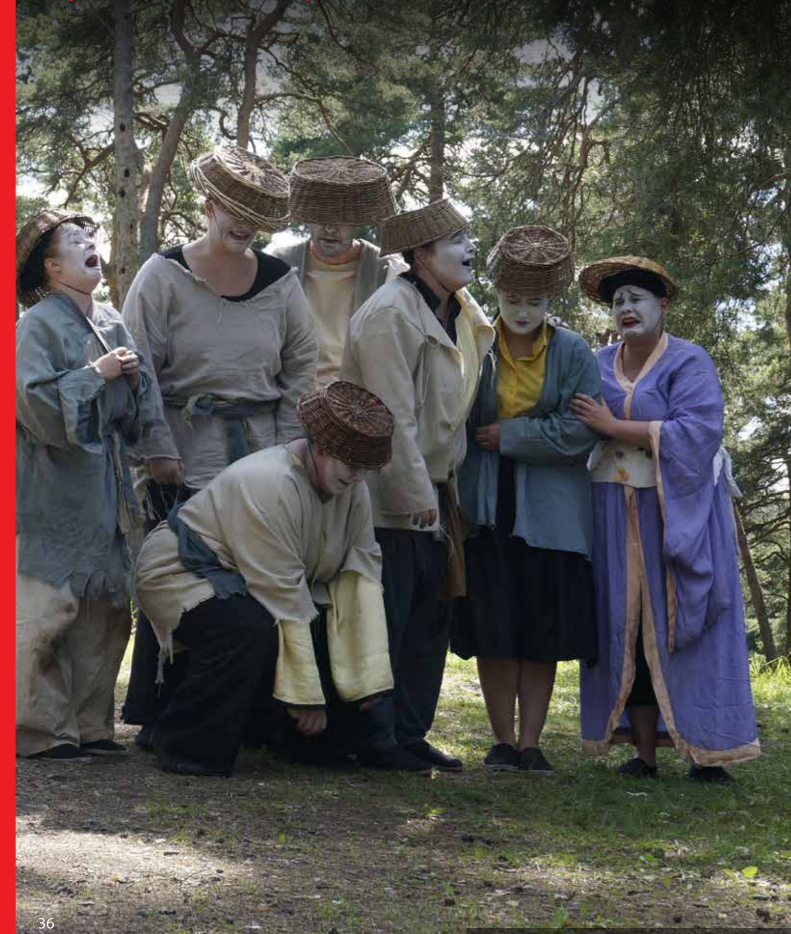
Leikfélagid Sýnir "De syv Samuraier", Island.