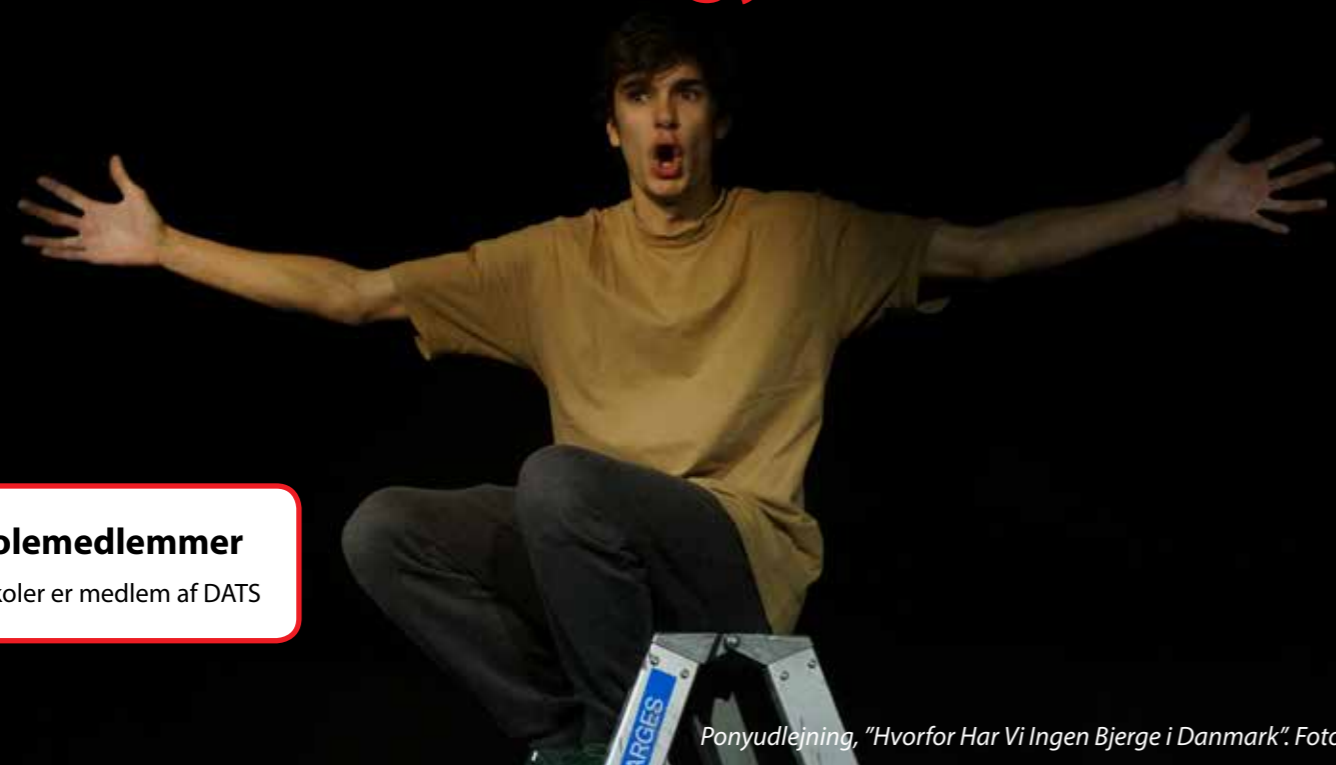
Ponyudlejning, "Hvorfor Har Vi Ingen Bjerge i Danmark".