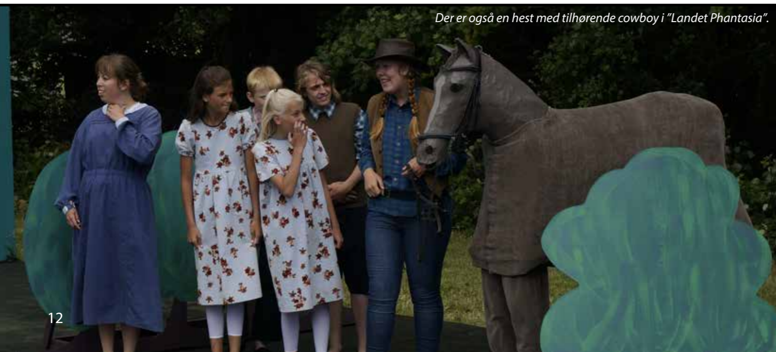
Der er også en hest med tilhørende cowboy i "Landet Phantasia".

Kulturminister Marianne Jelved (RV) understregede, at hun ikke ser det som en national strategi, der forpligter de lokale kommuner på bestemte ting. I stedet ser hun en vision, hvor alle partner sætter sig ned sammen og gør sig nogle fælles erkendelser, der kan pege frem samt inspirere. Hun understregede desuden, at initiativet skal komme nede fra, så det ikke kun bliver udtænkt på Christiansborg.