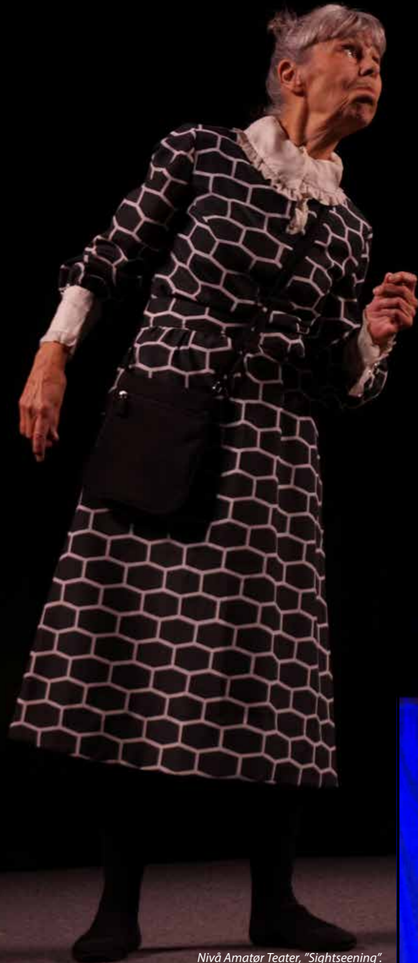
Nivå Amatør Teater, "Sightseeing".