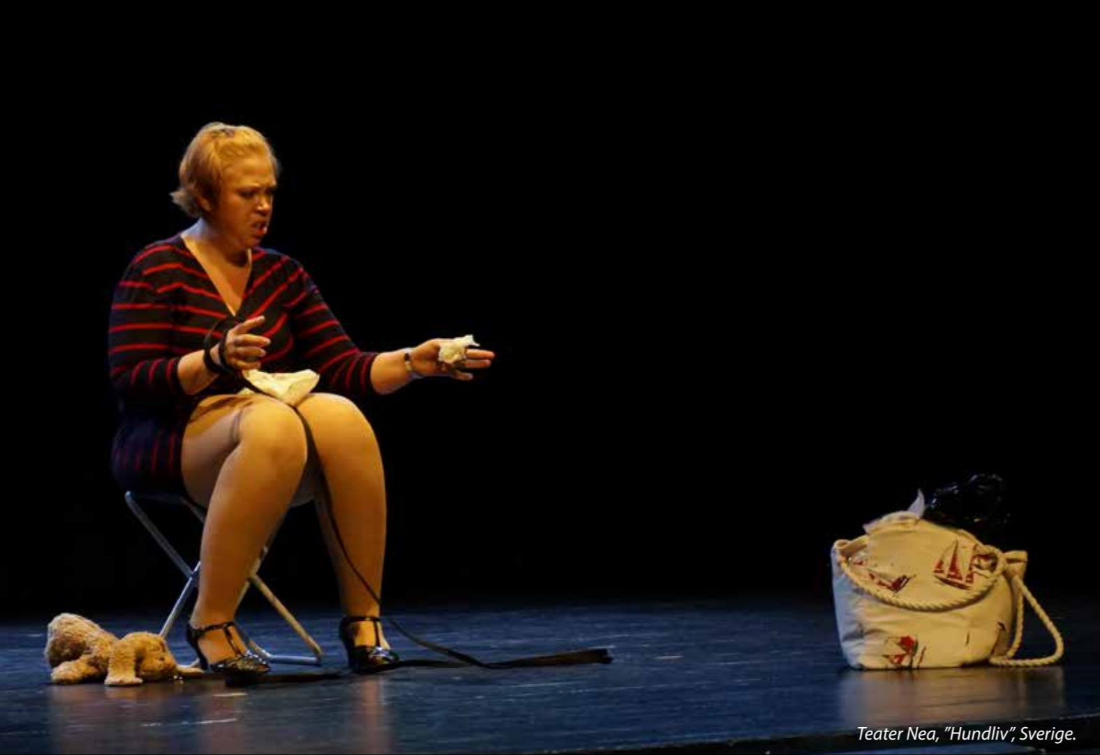
Teater Nea, "Hundliv", Sverige.

Scenen er bogstaveligt talt tom. En kvinde kommer ind trækende og hivende i – hvad der viser sig at være – en tøjhund. Teater Nea fra Stockholm har startet sin forestilling "Hundliv". Som kommentator tænker man: En kvinde alene på scenen i en time eller lidt mere? Holder det? Er der kunstnerisk substans nok til, at vi kan holde interessen så længe, når det er en monolog, vi skal se?