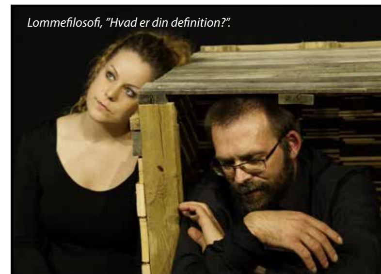
Lommefilosofi, "Hvad er din definition?".