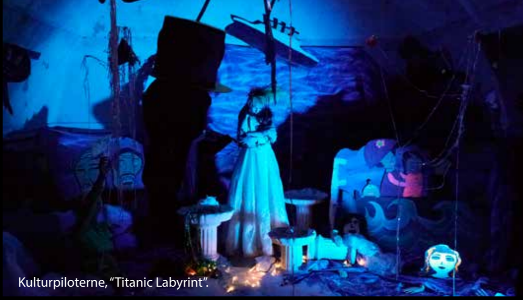
Kulturpiloterne, "Titanic Labyrint".

Kurser i DATS I 2015 fokuserer DATS på et nyt kursuskoncept: Hjemme hos kurser 9 forskellige kursustilbud, som man kan få hjem på scenen eller skolen. • I gang med instruktion • Skuespiltræning - for øvede og uøvede • Lys - skræddersyet ud fra jeres ønsker • LED lys • Kom godt i gang med scenografi og kostumer • Kommunikation for teatre • Sminkekurser - sminkning af børn og voksne • TUG TeaterUndervisnings Grundkursus for unge • TUL TeaterUndervisning af børn og unge, for ledere Læs mere om kurserne her http://dats.dk/kurser/dats-kurser/ Har man særlige kursusønsker, hjælper DATS gerne med tilrettelæggelse, undervisere og økonomi. Ring på 7465 1103 eller mail til dats@dats.dk