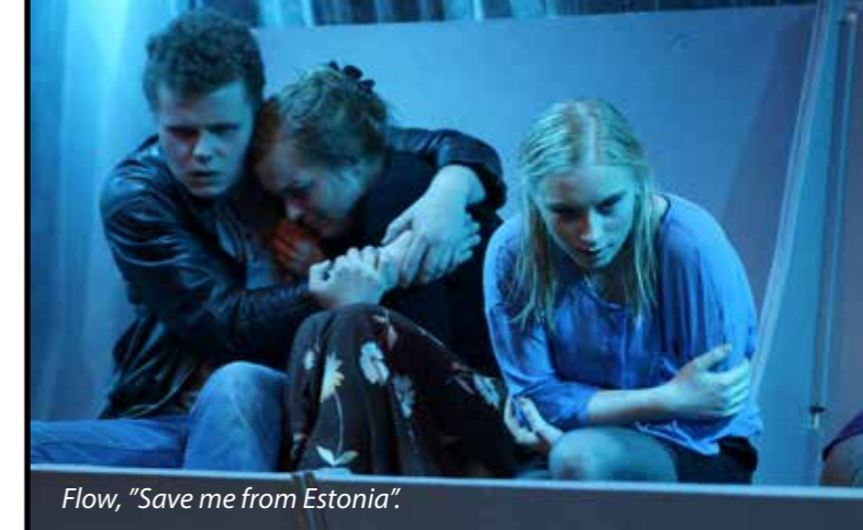
Flow, "Save me from Estonia".

Hold jer ikke tilbage i forhold til at kontakte vækstlagskunstnerne hverken før, under eller efter festivalen. Få eventuelt fat i et par af manuskripterne til brug før eller efter festivalen, eller overvej om eleverne eventuelt ville kunne få noget ud af at interviewe nogle af de deltagende kunstnere.