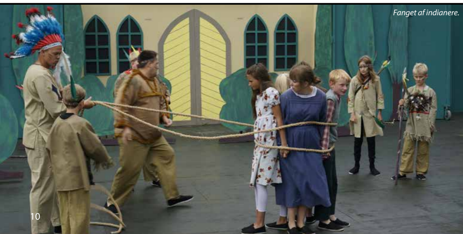
Fanget af indianere.