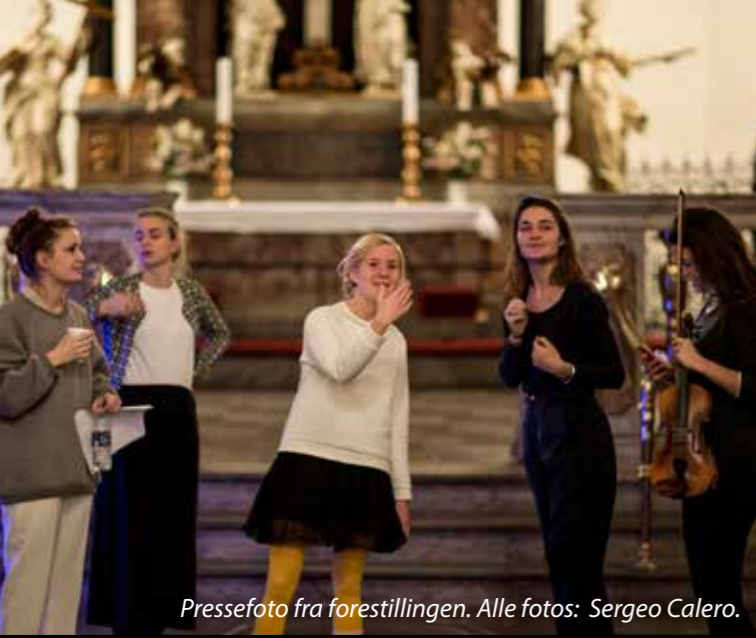
Pressefoto fra forestillingen.