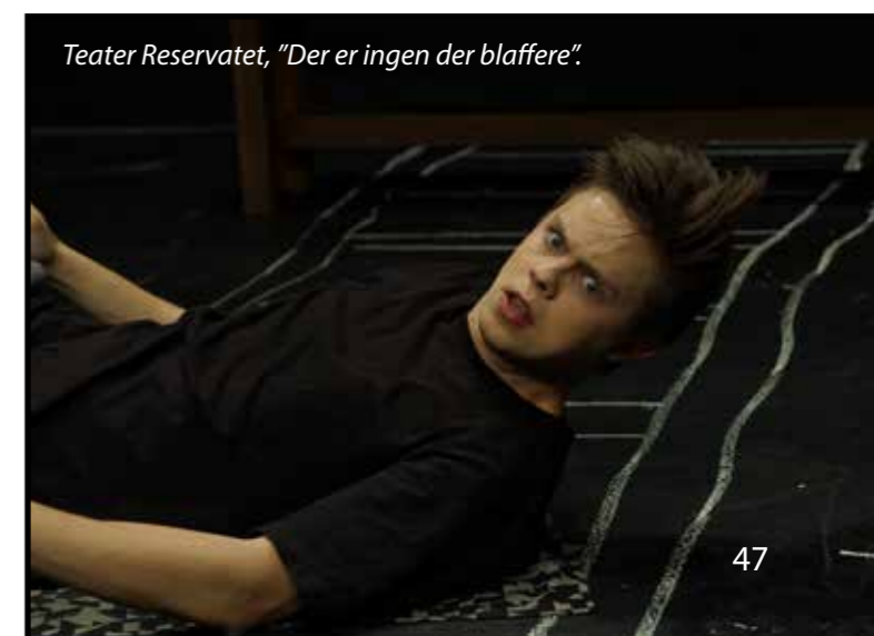
Teater Reservatet, "Der er ingen der blaffere".