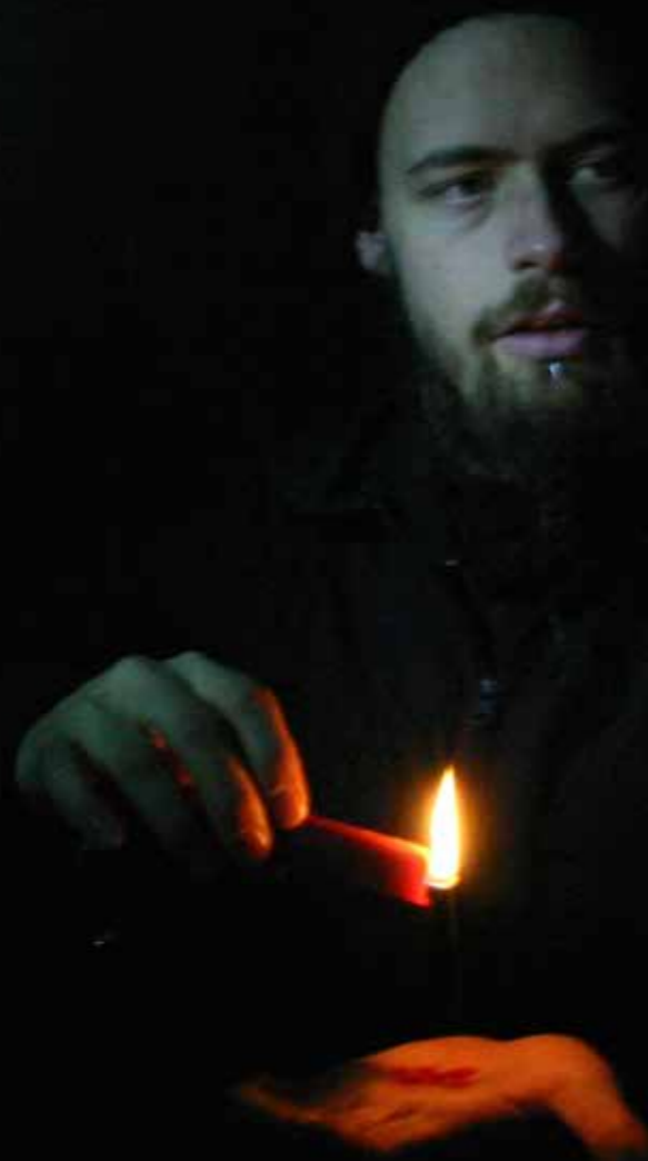
Teater Fluks "Flygtning Transportable".