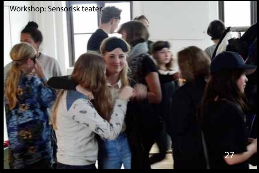
Workshop: Sensorisk teater.