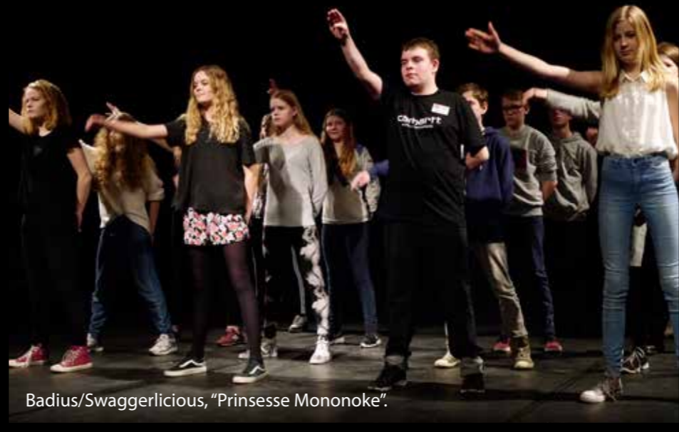
Badius/Swaggerlicious, "Prinsesse Mononoke".