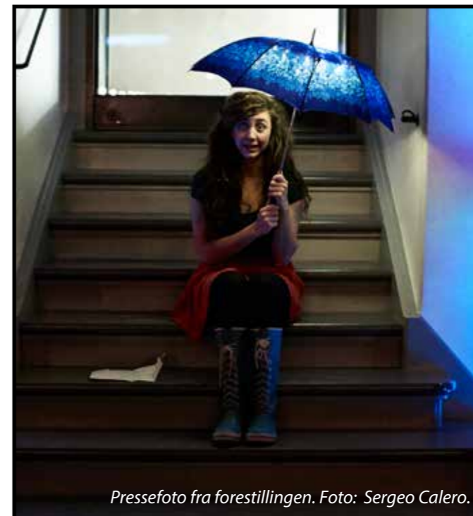
Pressefoto fra forestillingen.