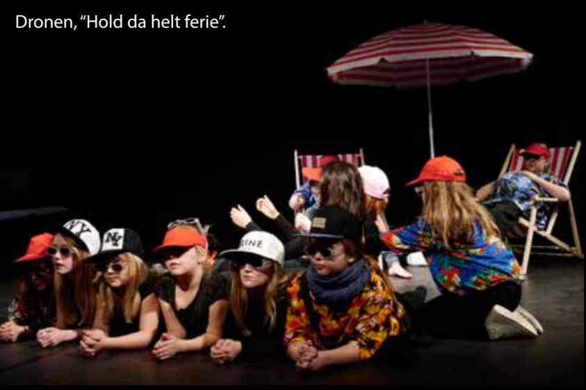
Dronen, "Hold da helt ferie".