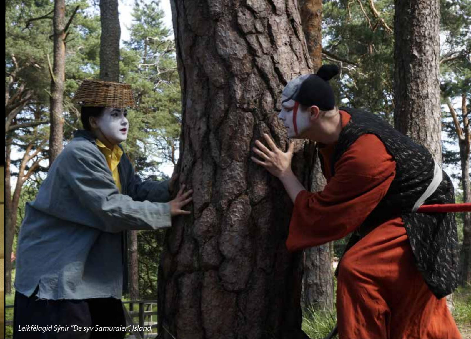
Leikfélagid Sýnir "De syv Samuraier", Island.

Som nævnt tidligere i artiklen var der uenighed i juryen i forbindelse med den danske forestilling "Tyskeren" af teaterkompagniet Skank Zoo. Der var ingen tvivl om, at mine jurykolleger følte sig provokeret af stykkets tone og tegning af karakterer. I stykket var en skuespillerinde, gjort til en tyk pige ved hjælp af en – i øvrigt meget naturtro – vatton. Især én af mine jurykolleger følte, at man på den måde gjorde nar af tykke mennesker på en ubehagelig vis. Jeg selv, som havde været med til at udvælge stykket til deltagelse på festivalen, var meget forundret over den opfattelse. Det samme var Skank Zoo-folkene selv, da de blev konfronteret med problemet ved teatersamtalen. Deres udgangspunkt var at gøre en slags grin med alle stykkets karakterer – men med kærlighed. Ikke ud fra noget ønske om at være ondskabsfulde.