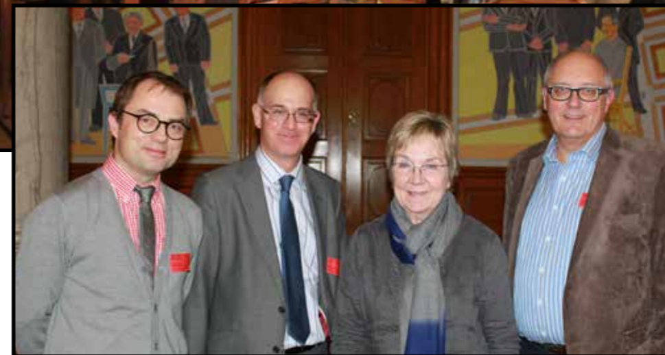
Tilhørende i salen.

DATS og AKKS vil i et fremtidigt perspektiv tage arbejdshandskerne på og undersøge, hvordan man bedst kommer videre med en vision for området, der kan gavne alle parter.