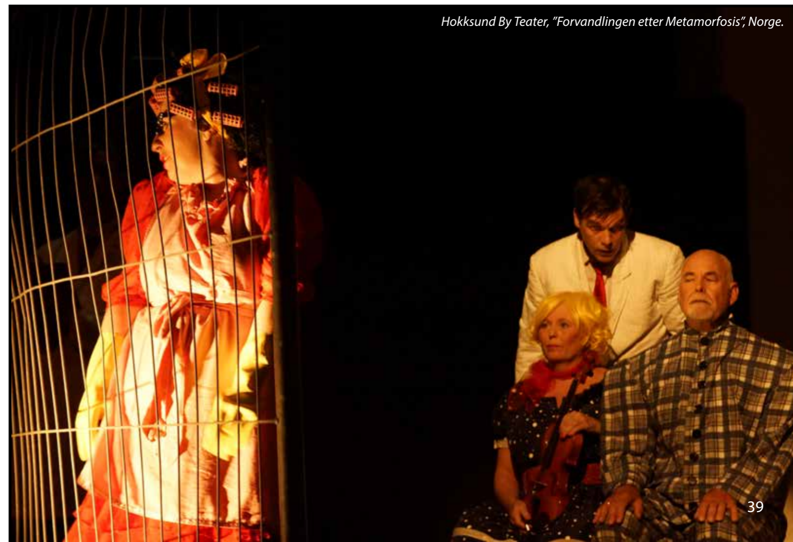
Hokksund By Teater, "Forvandlingen etter Metamorfosis", Norge.

Antal bevillinger: 14, samlet tilskudsbeløb: 42.700 kr.