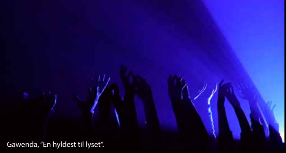
Gawenda, "En hyldest til lyset".