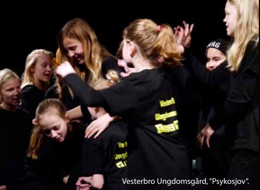
Vesterbro Ungdomsgård, "Psykosjov".