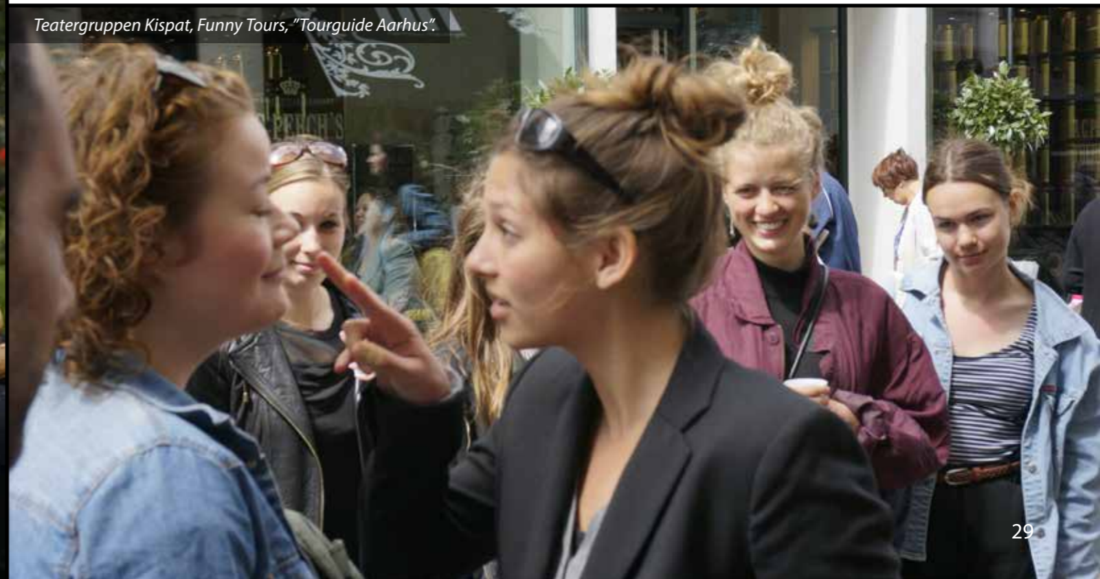
Teatergruppen Kispat, Funny Tours, "Tourguide Aarhus".

Derefter går turen til Pustervig Torv, hvor den topfrustrerede rejseleder udnytter "forvisningen" fra Domkirken til fulde,