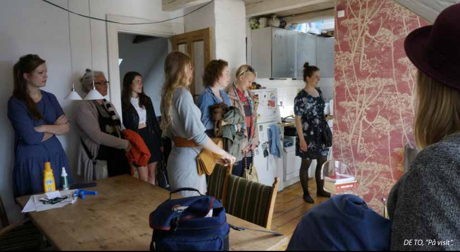
DE TO, "På visit"

i sin egen, private nedturs tour-de-force. Aarhus bliver vi ikke meget klogere på. Til gengæld bliver vi guidet grundigt rundt i guidens eget forulykkede liv, privat og professionelt. Det er tåkrummende pinligt på en meget direkte, pågående, og morsom måde.