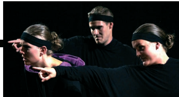
Den danske gruppe Black Box Pangea viste deres "Faustus" forestilling på IATA/AITA festival i Tromsø.