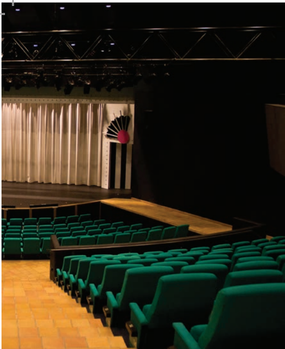
er NEATA festivalens store scene.

Stor fleksibilitet og mange udtryksmuligheder - gjort tilgængeligt på et lille budget.