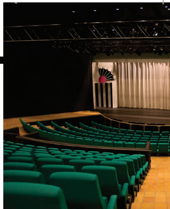
Det flotte og moderne Sønderborg Teater bliver N

shoppen, og vi har fået nogle gode og ambitiøse ansøgninger fra interesserede deltagere, så jeg tror, det bliver et spændende projekt, som jeg glæder mig meget til at afvikle. Workshoppen kommer til at arbejde ud fra festivalens overordnede tema "Kultur over grænser - teater over grænser". Jeg synes, det er interessant at formidle og forstå kulturen i de enkelte lande gennem teater eller andre former for kunst. Selv de mest moderne udtryksformer og genrer har rødder i nogle traditioner, der går mange hundrede år tilbage. Jeg tror, det bliver sjovt og spændende at mikse de forskellige udtryk i en samlet forestilling.