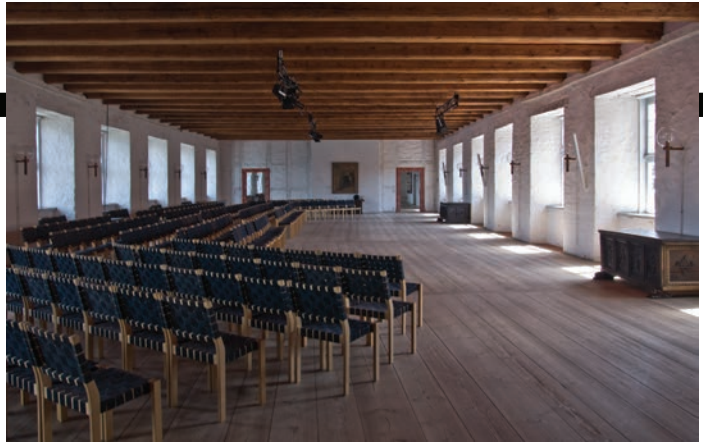
Riddersalen på Sønderborg slot danner den fornemme, historiske ramme om åbningen af NEATA festivalen.

DigiDeLight kulminerer den 4. august i et stort åbent eftermiddags-arrangement "3D-Digital Dramatic Dreams", hvor alle er velkomne. I kan godt sætte kryds i kalenderen allerede nu!