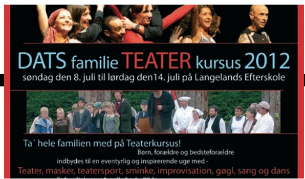
DATS familiekursus på Langelands Efterskole er et helt nyt kursusinitiativ.

Det kan enten ses som et legitimeringsproblem eller som en udfordring til DATS' selvforståelse. Er større medlemstal lig med større legitimitet overfor bevilligende myndigheder? Eller er det DATS' store arbejde som serviceorganisation, igangsætter m.v. for alt ikke-professionelt teater i Danmark, som skal udgøre kernen i DATS, og legitimeringen dermed fremstå som uafhængig af, om brugerne af DATS er medlemmer eller ej?