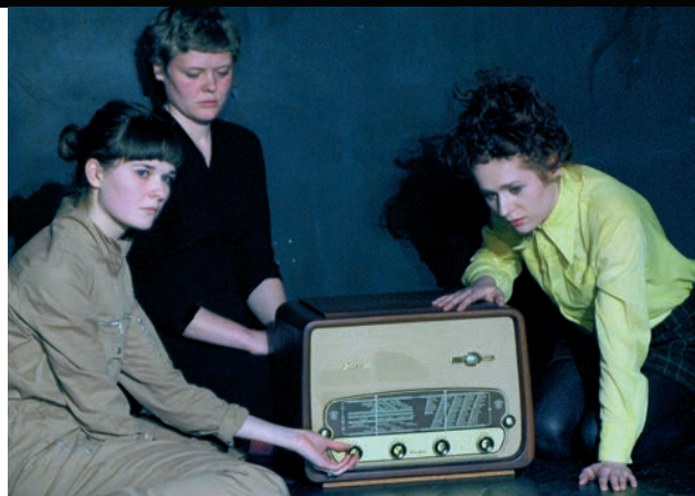
Arrieregårdens forestilling "Nowbodys home" på Sneskud Festival i TeaterHUSET, København.

Forståelsen af ordet amatør opfattes i det brede perspektiv, som en person der dyrker fx sin teaterkunst uden at have denne interesse som sit erhverv. Og vi, der hylder ordet amatør som en meget positiv betegnelse, må derfor leve med, at ordet amatør også kan bruges negativt. Det sker jævnligt, når nogen synes, at andre, der har det som deres profession at håndtere noget, ikke gennemfører dette professionelt nok, og på denne baggrund så kritiseres for at være amatører inden for deres professionelle arbejdsfelt.