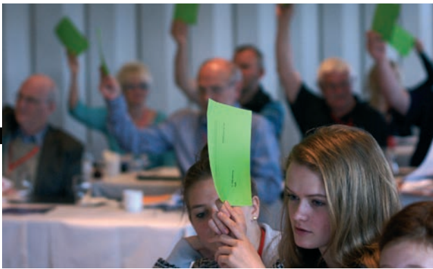
Medlemsdemokrati. Alle medlemmer – unge som gamle – kan stemme på Årsmødet.

Det er også sundt at høre om de forskellige vilkår amatørteatret har verden over, fordi det sætter ens egen situation i perspektiv; det rykker på egne definitioner af amatørbegrebet, når man hører og ser, hvor forskelligt amatørteater tolkes verden rundt.