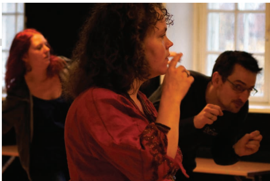
Efterskolelærere i fuld udfoldelse – under "Det store teaterprojekt" kursus på Scenekunstens Udviklingscenter i Odsherred.