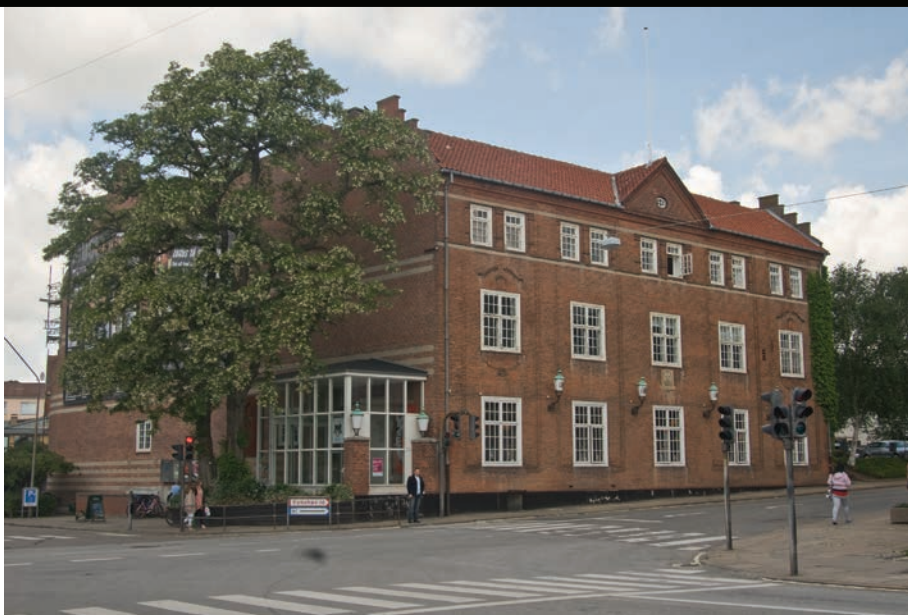
Sønderborghus i hjertet af Sønderborg bliver omdrejningspunktet for NEATA festivalen – med festivalkontor, kantine, teatersal og teatercafe.

NEATA Youth vil gerne give alle unge i alderen 18-25 år, der brænder for teater, en mulighed for at opleve et internationalt fællesskab omkring en festival. Derfor har vi valgt at etablere en intens workshop med en professionel