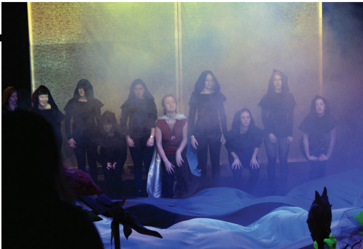
Et stort teaterprojekt. Langelands Efterskole opfører deres musikdramatiske gendigtning af "Den Uendelige historie".

Deltagerne har i evalueringen tilkendegivet, at de faktisk var lidt begejstrede over, at de kun var efterskolelærere på kurset, idet det betød, at undervisningen kunne tage direkte udgangspunkt i deres fælles virkelighed; efterskolen. Men enkelte har også bemærket, at erfaringsudveksling med deltagere fra andre områder af ungdomsteaterarbejdet dermed ikke var muligt.