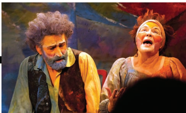
Midtfyns Amatør Scenes "Stolene" har fået professionel konsulentstøtte fra DATS.