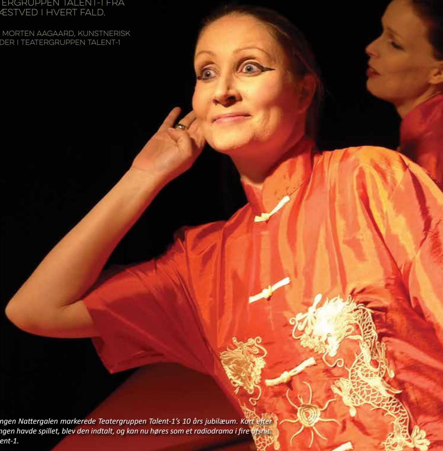
Forestillingen Nattergalen markerede Teatergruppen Talent-1's 10 års jubilæum. Kort efter forestillingen havde spillet, blev den indtalt, og kan nu høres som et radiodrama i fire afsnit.

AF MORTEN AAGAARD, KUNSTNERISK LEDER I TEATERGRUPPEN TALENT-1