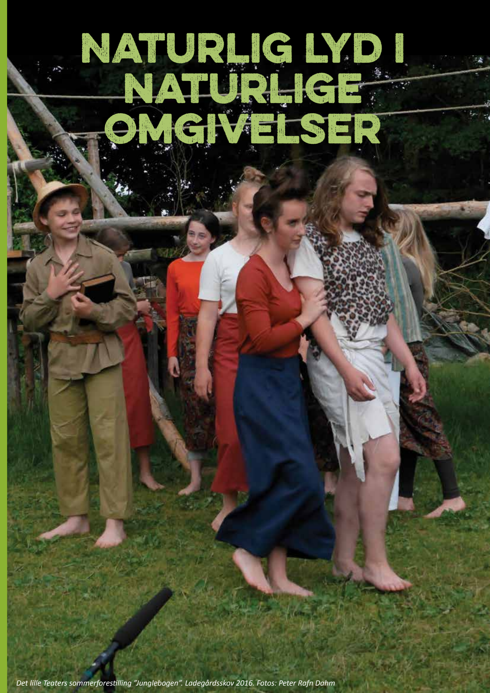
Det lille Teaters sommerforestilling "Junglebogen". Ladegårdsskov 2016.

LYDEN ER DEN STORE UDFORDRING, NÅR MAN SPILLER TEATER UNDER ÅBEN HIMMEL. AFSTANDENE ER STORE, DER ER OFTE LANGT MELLEMLER SPILLERE OG PUBLIKUM. OG DER ER INGEN VÆGGE ELLER LOFTER TIL AT "HOLDE" PÅ STEMME OG REFLEKTERE DEM. HVORDAN SKAL MAN HØRE, HVAD DER BLIVER SAGT? EN MEGET UDBREDT LØSNING ER AT BRUGE MICROPORTS, SMÅ TRÅDLØSE MIKROFONER PLACERET TÆT PÅ SPILLERENS MUND. MEN FINDES DER ANDRE MÅDER AT GØRE DET PÅ?