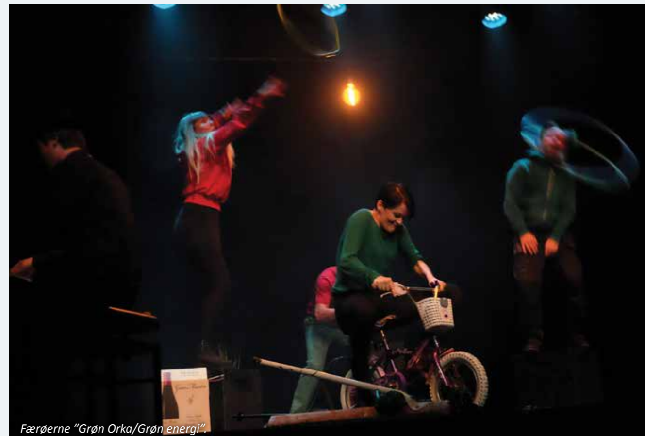
Færøerne "Grøn Orka/Grøn energi".

Island). Fra færøsk side tilbød man at udvide denne lille nordatlantiske festival til at omfatte alle NEATA-landene. Man ville "opgradere" den lille "lokale" internationale festival til at være den officielle NEATA-festival 2016.