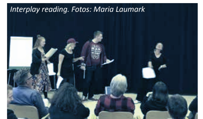
Interplay reading.