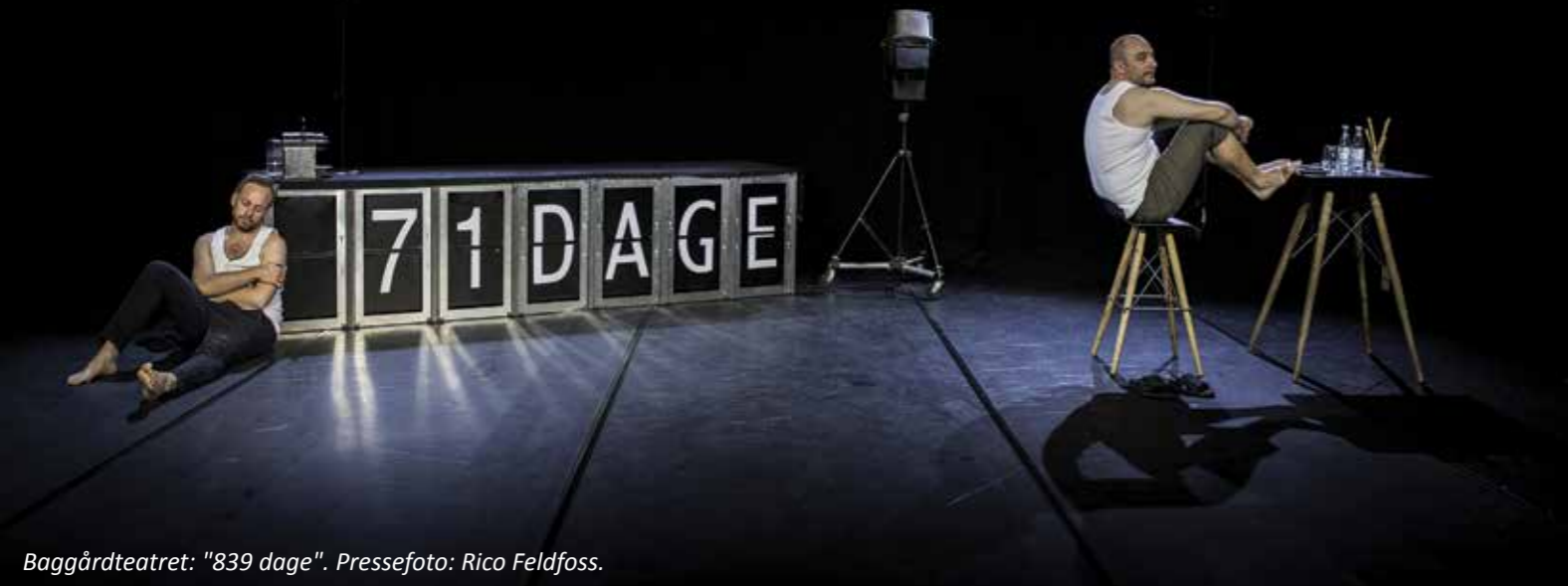
Baggårdsteatret: "839 dage".

AF MORTEN HOVMAN, SCENEINSTRUKTØR, TEATERKONSULENT