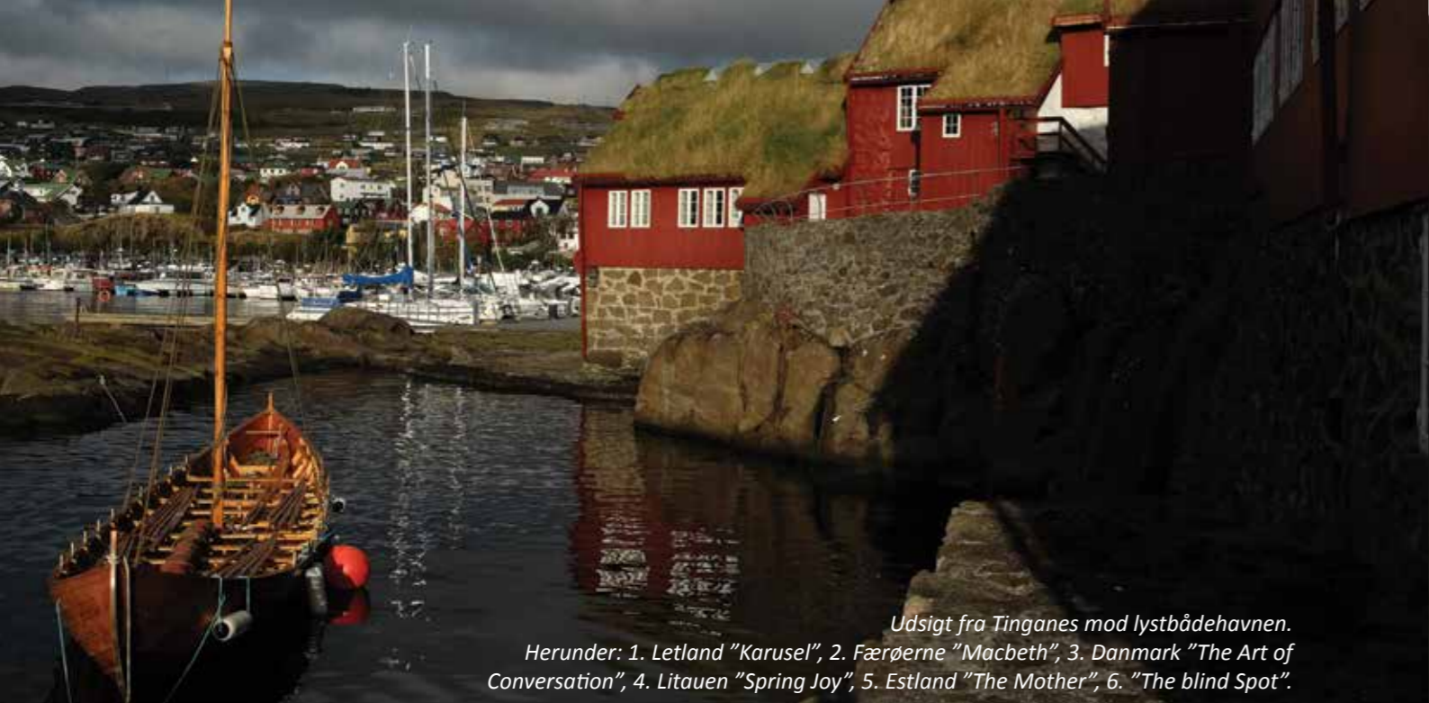
Udsigt fra Tinganes mod lystbådehavnen. Herunder: 1. Letland "Karusel", 2. Færøerne "Macbeth", 3. Danmark "The Art of Conversation", 4. Litauen "Spring Joy", 5. Estland "The Mother", 6. "The blind Spot".