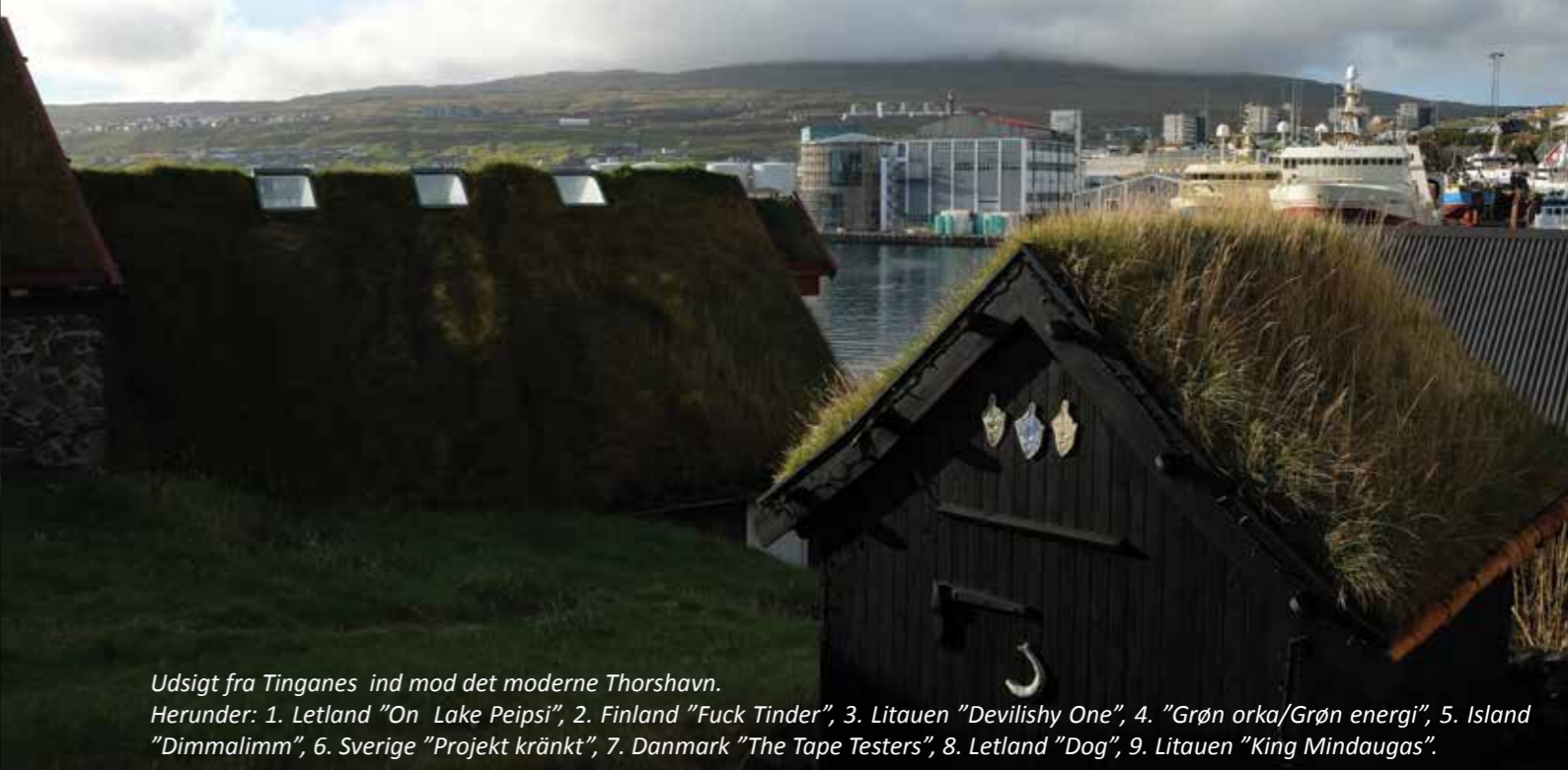
Udsigt fra Tinganes ind mod det moderne Thorshavn. Herunder: 1. Letland "On Lake Peipsi", 2. Finland "Fuck Tinder", 3. Litauen "Devilshy One", 4. "Grøn orka/Grøn energi", 5. Island "Dimmalimm", 6. Sverige "Projekt kränkt", 7. Danmark "The Tape Testers", 8. Letland "Dog", 9. Litauen "King Mindaugas".