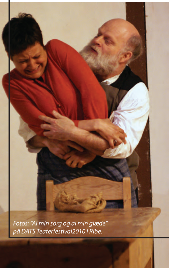
Fotos: "Al min sorg og al min glæde" på DATS Teaterfestival 2010 i Ribe.