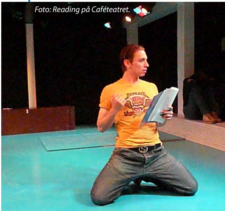
Foto: Reading på Cafeteatret.

Det er for det meste vækstlagsdramatikere, der får en tekst antaget til reading. Tilmeldingen til at sende tekster ind ligger gerne i marts måned. Hold dig opdateret på www.cafeteatret.dk/manuskriptudvikling/