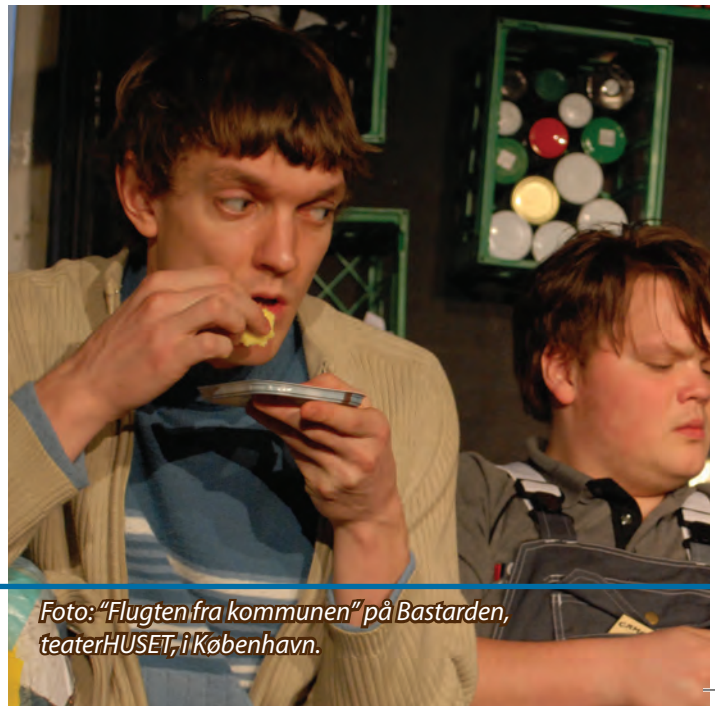
Foto: "Flugten fra kommunen" på Bastarden, teaterHUSET, i København.

Jeg udviklede mig meget ved at gennemlæse de andres tekster og give dem feedback. Det blev nemmere at genkende fejlene hos mig selv. Jeg er blevet meget mere fokuseret på, at det skal fungere rent teknisk, det vil sige dramaturgisk og med spændingskurver. At det ikke skal være så rodet. At det også handler om at simplificere - at hive det frem, man gerne vil sige og fjerne alt det uden om.