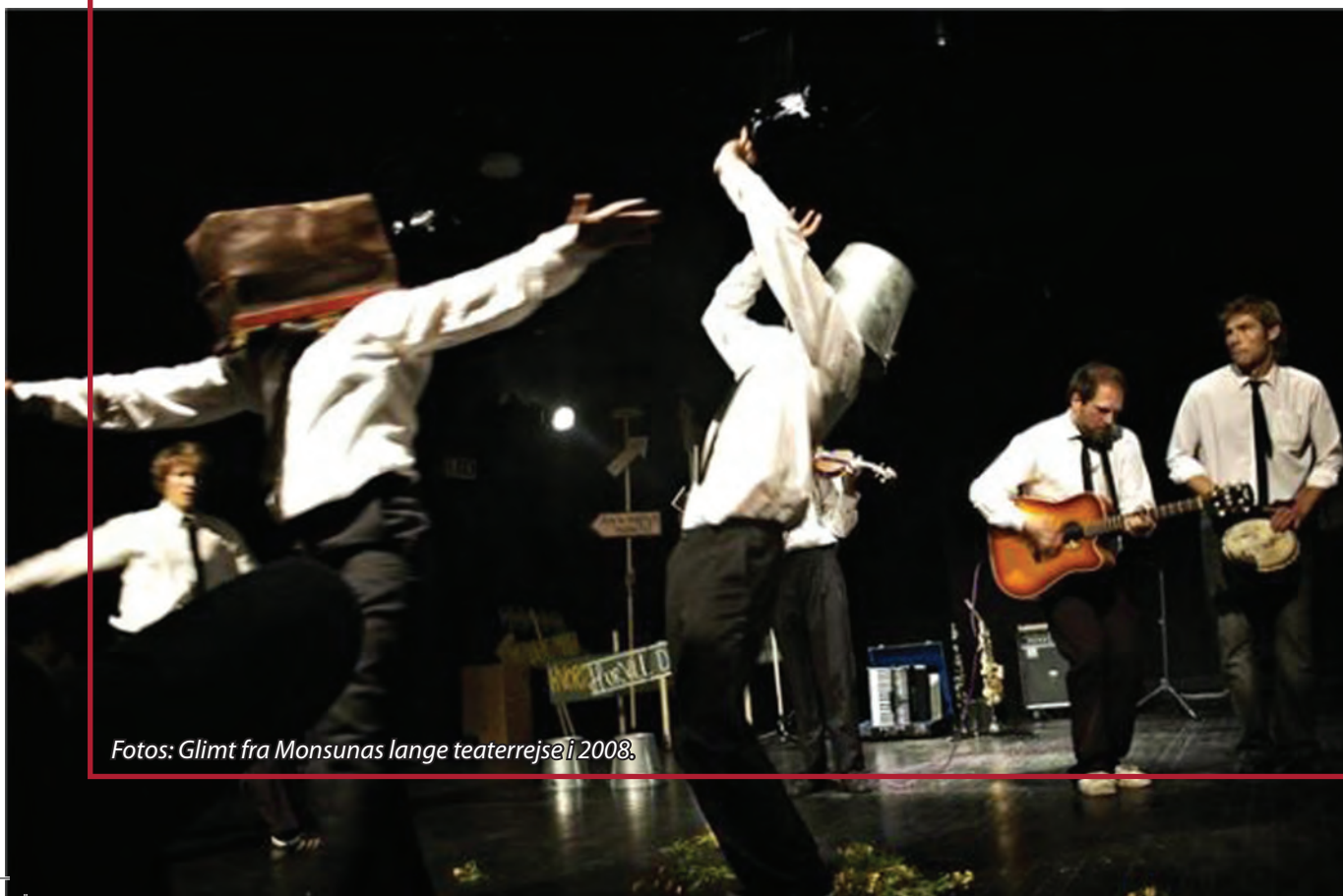
Fotos: Glimt fra Monsunas lange teaterrejse i 2008.

Den først scene vi skabte var diktatoren. Instruktøren havde en ide om, at der skulle være en scene med en henrettelsespeloton, dramaturgen gik herefter i gang